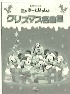
のクリ に定番 のクリ のクリ

スマソングを楽しめる、初級向けのやさしい名曲集。全編オールカラーで、至るところにディスプレイの人氣キャラクターが散りばめられているので、ウキウキしながら弾くことがうれしい！ それぞれ歌詞もついているので、ソロでひくほか、みんなで楽しく歌っちゃおう！ 全21曲。