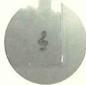
こちらが表紙紙右下部分のフンポイント。カバーをかける際の目印にもなりますよ♪