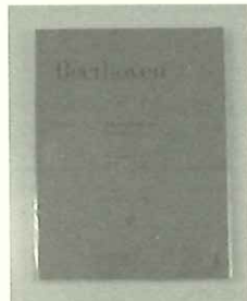
ステキだけど強度が心配だったヘンレ版の楽譜もこれで安心♪最厚級のベトーヴェン・クラヴィアソナタもしっかり保護できます。