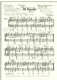
(白楽譜への書き込み例)

が出来上がりしました。それが演奏の面白さだと思います。将来、生徒が四期の名曲に取り組むとき、自分でアナリーゼし楽譜に書かれた記号に疑問を持って理由を追求する……そのような楽譜の読み方ができれば、素晴らしいと思います。そのためのアナリーゼ導入教材として、白楽譜は最適です。「何小節? 曲の形式は?」「フレーズはいくつ?」「何拍子? なぜこの拍子を選んだのだろうか?」「何調でどういうキャラクターの曲?」「和音進行や転調で、曲がどう変化した?」など、生徒それぞれが考えを持って学習できます。先生や、生徒同士で書き込みを見比べ、意見交換するのも勉強になるでしょう。バロック白楽譜はレッスンの幅を広げ、豊かな演奏表現につながります。楽譜の使い方、ピアノの学び方が変わります!