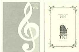
【マンズリー&ウィークリー】1,620円