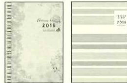
【スリム マンズリー】1,080円