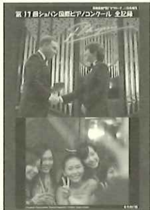
(画像はイメージです)