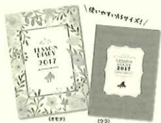
【マンスリー&ウィークリー】 1620円