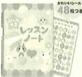
▲レッスンノート(にやんこ)