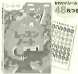
▲レッスンノート(きょうりゅう)