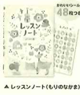
▲レッスンノート(もりのなかま)