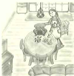
「ピアノなんて大きい！」 やる気をなくしてしまったミミは…… 絵：たかきみや

LPO編集室：〒174-0063 東京都板橋区前野町3-43-7 楽譜専門部 松沢書店内 TEL：03-5970-5981