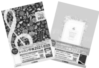
マンスリー& ウィークリー

♪レッスン手帳2021 マンスリー&ウィークリー 1500円+税 スリム&マンスリー 1000円+税 (藤 拓弘 監修/ヤマハ)