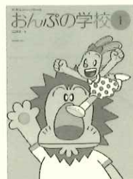
全①～⑥巻、 その他、「ピアノの学校」 「スケールの学校」がある。 また、補助教材も多数。