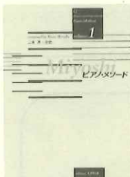
テキスト①～⑧巻、併用曲集として「ひびきの森」、また、演奏収録CDが、ピクチャーより出ています。