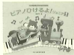
「テキスト」「ワークブック」①～③巻、 「リパートリー」A～C巻、その他、 「ピアノひけるよ! シニア」が。