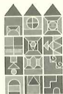
勢いにかかせて弾くのではなく、一音一音ゆつくりと静かに弾くよう指導して下さいね。

毎日の練習12か月・1 DAILY EXERCISES FOR 12 MONTHS・1 ~うたう指づくり~