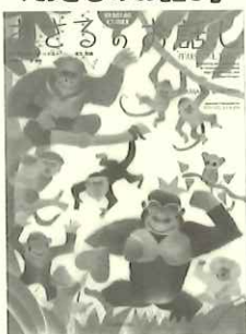
楽譜を見ただけで、思わずにっこりしてしまうようなユーモラスさが◎。