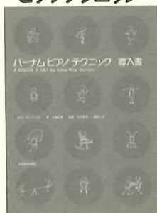
楽器店でもダンツの売上を誇る本書。ミュージック・データも是非お試しあれ!

体的にイメーシしながらテクニックをつけていくことができます。後半では変拍子、トーン・クラスターなど現代音楽の奏法も。また「全調の練習」は5指のポジションで作曲され、初級者が全調を体得するテクニックのエチュードとして最適。