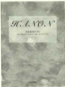
大人の方は教材にもこだわりを持ってもらいますよ。【何がなんでもハノン!】という方に。

——以上、「ご紹介してまいりましたが、今回紙面の都合上紹介しきれなかった教本もたくさんあり、悔しいところですが、そのお詫びに、いつか当HP「LPO CLUB」にて、特集として取り上げられたらと思っておりますので、どうぞお楽しみに♡