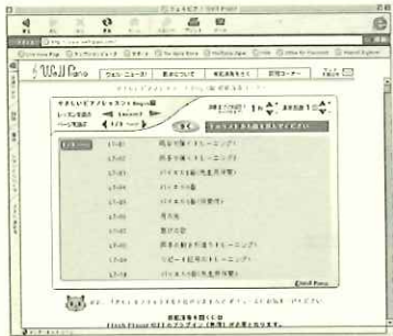
こちらは「模範演奏試聴ページ」。それぞれの演奏の表示番号は、テキストの番号と完全対応しています。