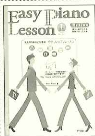
編著者 ウェルピアノ アレンジ協力 ひるさきあゆみ 発行 特デプロ 本体価格 1200円 以後、続刊予定

バイエルの上巻の前半部分にあたり、両手で弾くことができるレベル。ただし、音域はト音記号のド(ソ)までで押さえてあり、指変えもでてこないようにしてあります。