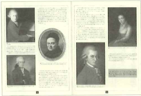
「モーツァルトの生涯」のページより。このように、美しい肖像画や図版がふんだんに盛り込まれています。カラーでお見せできないのがとっても残念！

まず収録曲については、ピアノ曲だけに限らず、協奏曲、交響曲、オペラ、管弦楽曲、室内楽曲、聖歌音楽、歌曲など、いろんなスタイルの作品から幅広く選び、そのそれぞれを簡単に興味深いアレンジに仕上げました。また、詳しい伝記や色鮮やかなイラストからは、作曲家達の人生や歴史的背景を見ることができま