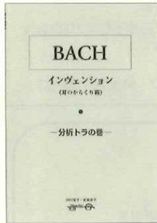
このCD・Mデータは、まさに「百見は、一聞に如かず」! 楽譜とセットで、インヴェンションの構造が、即理解できます!