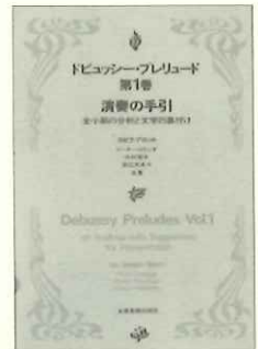
執筆は、ジュリアード音楽院で30余年教鞭を執られていた、J. フロット教授をはじめ、充実の執筆陣で。

いずれも薄型ながら、作品理解、演奏上のヒントがギッシリ詰まったシリーズ。作曲家の意図や時代の背景、楽曲構成など、曲に関するあらゆる裏付けを学びたいことを目的としています。