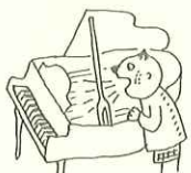
『ピアノの弦であそぼう』より

まず、「ピアノの弦であそぼう」をもとに、ピアノの弦に向かって先生としたりと、弦に向かって声を出すことで弦が声に反響し、その響きを楽しむことで、自然に大きな声が出されます。また、絵本をお互いに読み合いながら、二人でページごとの即興曲を作り上げていく