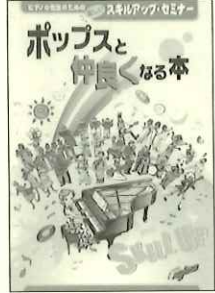
ピアノの先生を対象に書かれているので、生徒別対応法などのトピックも。

実際にリズムパターンを弾いて感覚をつかむ「お試しドリル」、さらには楽譜リライト術からアレンジのアイディア集まで盛り込まれた充実の内容。この二冊でかなりの部分をカバーできるはず。