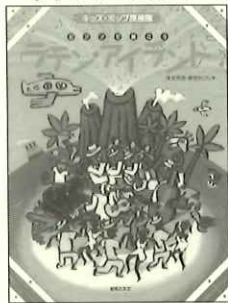
とにかく、楽ししかげがほしい曲集。姉妹版「ジャズ・パラダイス」(音友 1400円)もぜひ。