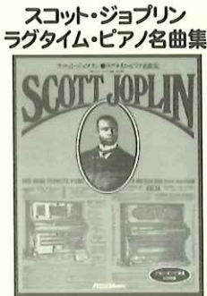
ジョプリンは、自分の作品があまりに速く弾かれることを好まなかったとか、楽譜の速度指定に忠実な模範演奏CDを聴くと、なるほど、かなりゆったり！

数多くのすぐれたラグタイム作品を生み出した、「ラグタイム王」スコット・ジョプリン。洋書を含め、各社より楽譜が出版されていますが、特におススメなのが本書。大きな譜玉、濃い印刷といった譜面の見やすさに加え、丁寧な楽曲解説、ジョプリン自身による「ラグタイム講座」も収録。一方、模範演奏CD（6曲入り）が付いているのは「スコット・ジョプリン・ラグタイムピアノ名曲集」（長瀬隆子編／ジヨウヤング校訂CD演奏／リットー 18000円）。ジョプリンの肖像が描かれた表紙も◎。