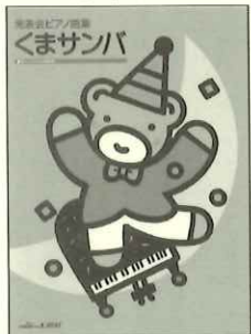
表紙も収録曲も、so cute! シリーズ連弾曲集「もくもくプギ」もおさんぽスウィング! (ガフイ)も要チェック!!