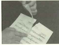
♪破れた部分の補修に