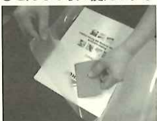
♪楽譜のブックカバーに