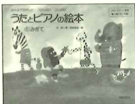
「うたとピアノの絵本」 みて②③だけ④⑤も

なにごとありそうです。 そこで今回は、これらのポイントをふまえて、おすすめテキストをご提案します！