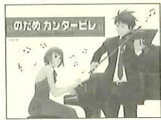
ピアノの「のたためカンタービレ」 840円(ヤマハ)

ピアノの「のたためカンタービレの世界」【入門編】【上級編】各1680円(シンコー) 「のたため」の登場人物が、現代のクラシック音楽界でも「さわりで覚えるクラシックの名曲」(中経出版 1470円)をはじめとするシリーズ(モーツァルト、ピアノ、日本の唱歌、ジャズほか、さまざまなジャンルあり)が好セラーズを記録しました。そついつの意味では、2005年はクラシック愛好者の裾野を広げた一年だったと言えるかも知れません。その流れが来年以降の音楽人口増加につながりますように!